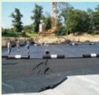
Отель Сарвар, Венгрия, гидроизоляция подвальной части