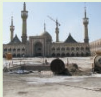
Мечеть Имама Хомейни, Иран, гидроизоляция кровли