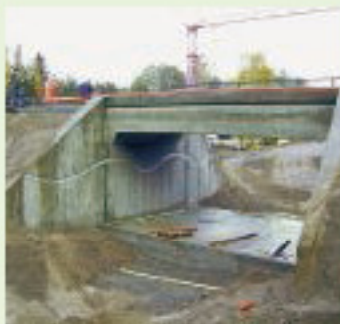
Железнодорожный мост Эстра, Швеция, гидроизоляция тоннеля