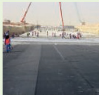
Аэропорт Джебел Али, ОАЭ, гидроизоляция подвальной части