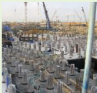
Апартаменты Палм Джумейра Марина, ОАЭ, гидроизоляция подвальной части