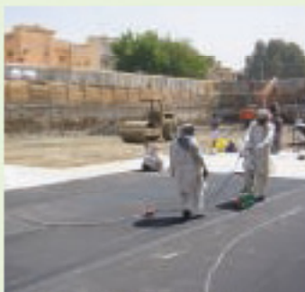
Национальный арабский банк в Джедде, Саудовская Аравия, гидроизоляция подвальной части