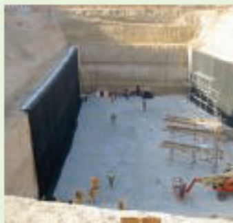
Международный аэропорт в Дубаи, ОАЭ, гидроизоляция тоннеля