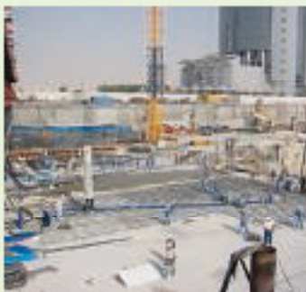
Башни-близнецы в Аль Фардане, Катар, гидроизоляция подвальной части

- гидроизоляция, выполненная с помощью Эластосил ЭПДМ-системы для заглубленных конструкций